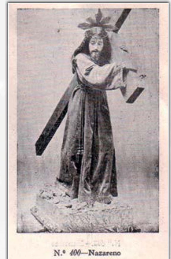
Foto enviada por el escultor a la que se refiere en la 1ª carta